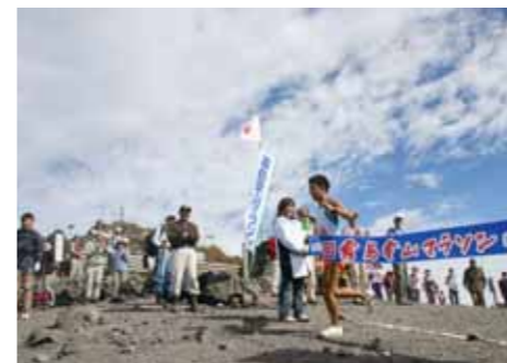
霧島登山マラソン(高原町)