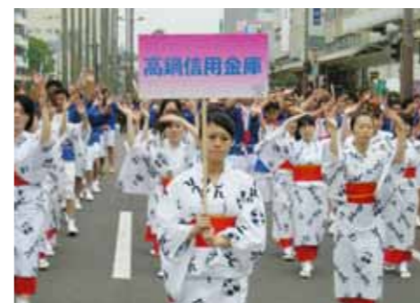
えれこっちゃんやざき(宮崎市)

職員自身も居住地での自治公民館活動や各種グループ活動の一員として積極的に参加し、地域とのふれあいを大切に、地域社会の一員として地域のお祭り、イベント等諸行事にも積極的に参加しております。