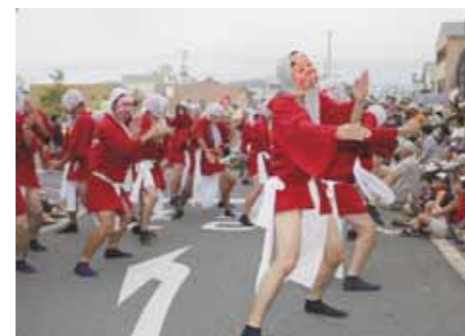
ひよっこ踊り(日向市)